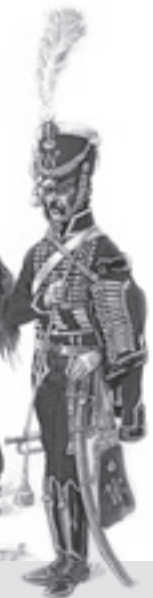
Ritmeester en trompetter van het regiment der Huzaren nr 8 1815.

Na de door Napoleon verloren “slag der volkeren” in oktober 1813 bij Leipzig, ontstond er in ons land op verschillende gebieden een koortsachtige activiteit. Zo maakte het Franse bezettingsleger zich op voor de strijd tegen de Kozakken en de Pruisen die onze grens naderden, maar ook anderen werden actief. Een aantal vooraanstaande Nederlanders bereidde alvast de omwenteling voor van het Franse Bleu naar het Nederlandse Oranje, en dat bij voorkeur zonder volksoproer. Franse bestuurders vertrokken, maar Franse troepen hielden nog wel een aantal steden bezet. Bij Scheveningen kwamen Engelse troepen aan