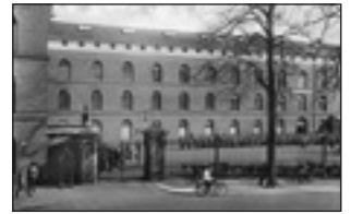
Twee beelden van de voormalige Boreelkazerne in Deventer.

tot grote veldslagen kwam trokken de troepen van Willem I geleidelijk verder in Zuidelijke richting op, bezetten steden als Turnhout en Hasselt en tenslotte Leuven, maar tot een verovering van Brussel kwam het niet. Uiteindelijk immers werd de strijd na 10 dagen beëindigd door een Engels-Franse diplomatieke actie, onder de dreiging dat anders een Frans leger zou ingrijpen.