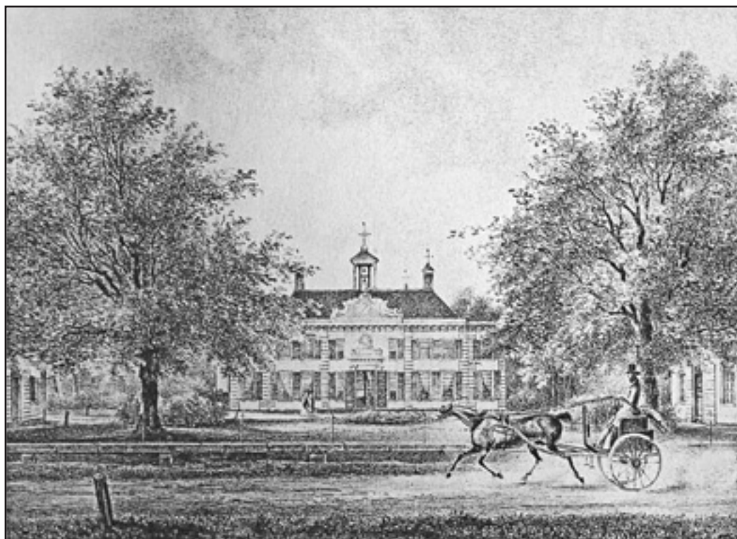
Beekestijn in 1840, door P.J. Lutgers.