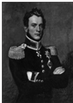
Willem prins van Oranje in 1819.

Na zijn rol bij de strijdaferelen van 1814 en 1815 wordt zijn leven in militair opzicht wat minder enerverend. Het gezin Boreel verblijft, zoals toen gebruikelijk, in de zomermaanden op de buitenplaats Beekestijn te Velsen. Beekestijn was Boreels eigendom sinds zijn moeder op 23 januari 1813 was overleden. Nadat hij eigenaar was geworden heeft hij de nodige veranderingen op Beekestijn laten aanbrengen, volgens de opvattingen van de 19e eeuw. De entree wordt vervangen door deuren met veel glas erin, de voordeur en de ramen worden voorzien van luiken, de muren worden wit gepleisterd. Aan de straatzijde wordt de muur met daarin de speelhuisjes vervangen door een laag muurtje met daarop ijzeren paaltjes, waartussen kettingen van afwisselend ronde en langwerpige schakels. De toegang tot het voorplein gaat lopen via twee ingangen ter hoogte van de beide koetshuizen. Deze veranderingen zijn zichtbaar op de door Lutgers rond 1844 vervaardigde lithografie. Ze dateren dus van vóór dat jaar. Waarschijnlijk is het ook Willem François geweest die in het begin van de 19e eeuw nabij het huis een orangerie in neoclassicistische stijl heeft laten bouwen. Ook binnenshuis is er verbouwd, maar bijzonderheden daarvan zijn niet bekend. 16