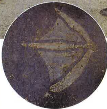
6. Ganzevoet. Drie in een punt samenkomende lanen vanaf het centraal plateau, met de geplaatste steen. Ontwerp SB4.