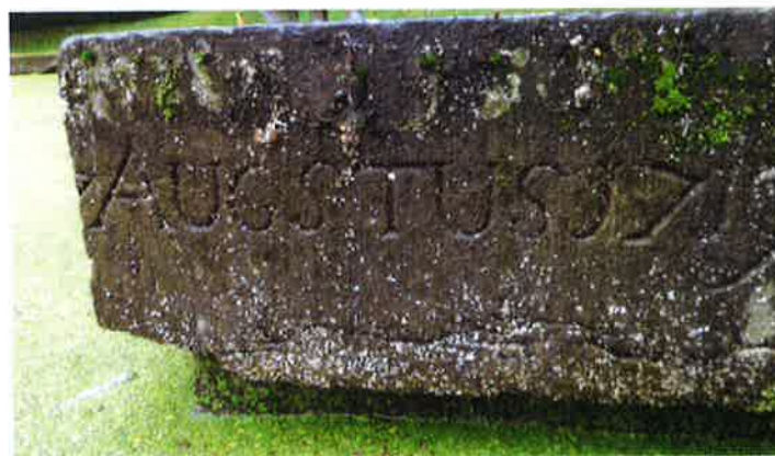
2. De gerestaureerde waterkom met daarin de originele jaarsteen uit 1719, stam-mend uit de tijd van het echtpaar Trip-Van Hoorn.

Uit de analyse van SB4 bleek dat uit allerlei an-