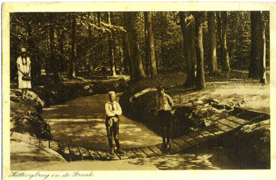
1. De kettingbrug van de Braak op een oude ansichtkaart, verstuurd in 1923, dus drie jaar na de aankoop door Natuurmonumenten. Collectie auteur.